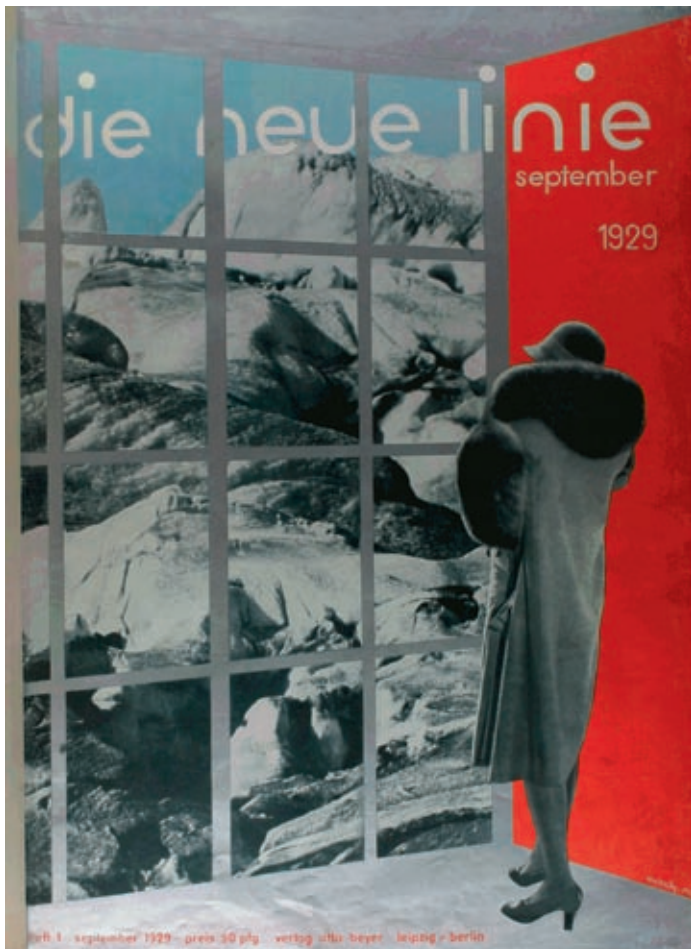
»die neue linie«, Umschlag der ersten Nummer vom September 1929, Entwurf: László Moholy-Nagy