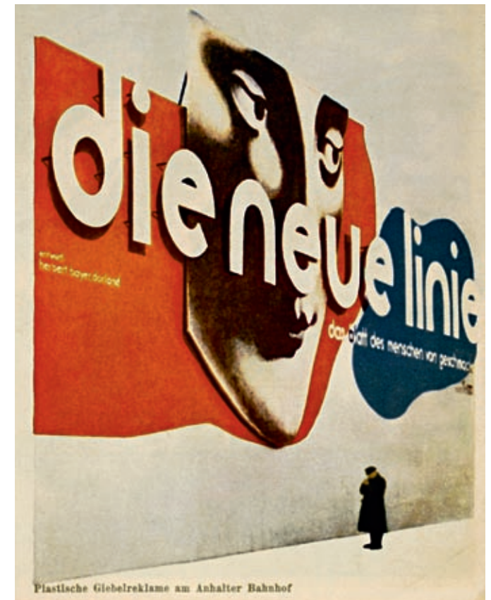
Außenreklame für »die neue linie« am Anhalter Bahnhof, ca. 1932, Entwurf: Herbert Bayer

Inhaltlich setzte »die neue linie« auf ein anspruchsvolles Niveau. Literarische Gastautoren wie Aldous Huxley, Gottfried Benn und Thomas Mann lieferten Beiträge. Der Modeteil bildete raffinierte Entwürfe ab, die die elegante Damenwelt der Weimarer Republik ansprachen. Großes Gewicht hatte alles, was mit »Schöner Leben« zusammenhing – das macht »die neue linie« zu einem Vorläufer heutiger Lifestyle-Magazine. Aktuelle architektonische Trends stellte u. a. Walter Gropius vor, als vorbildliches Design wurden Bauhausmöbel oder die »Frankfurter Küche« präsentiert.